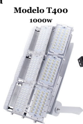
Modelo T400 1000w