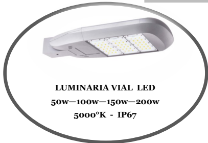
LUMINARIA VIAL LED 50w-100w-150w-200w 5000°K - IP67