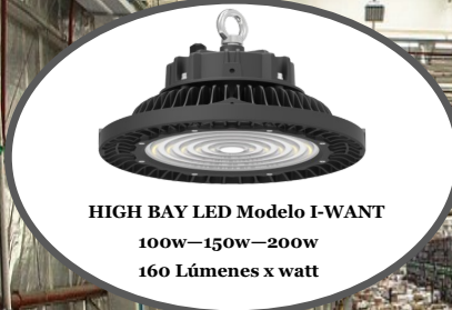
HIGH BAY LED Modelo I-WANT 100w-150w-200w 160 Lúmenes x watt

Consúltenos +562 28870110 comercial-2@gescomchile.com