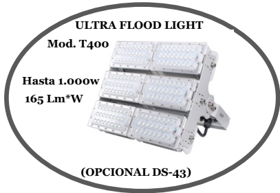
ULTRA FLOOD LIGHT Mod. T400 Hasta 1.000w 165 Lm*W