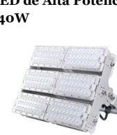
Modelo T400 600w