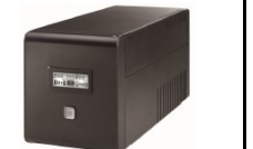
KIT DE EMERGENCIA (UPS) 1KVA - 600W