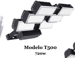
Modelo T500 720w