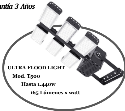
ULTRA FLOOD LIGHT Mod. T500 Hasta 1.440w 165 Lúmenes x watt