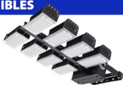
ULTRA FLOOD LIGHT LED Hasta 1.440W — 165 Lm/W