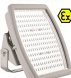
ANTIEXPLOSIVAS LED Para distintas aplicaciones Hasta 185W