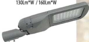
LUMINARIA VIAL LED 100W - 150W - 200W 5700°K - 3000°K (DS-43)