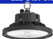
HIGH BAY LED 100W-150W-200W 160 Lm/W - IP-66